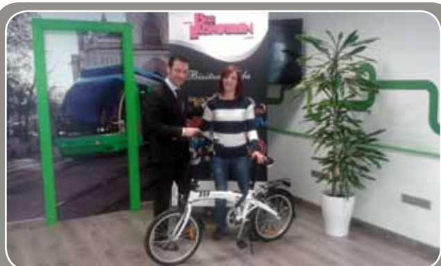
Bizikleta eman zitaion uea Bizieuskotren Argazki Lehiaketako lehen saridunari Entrega de la bicicleta, primer premio del Concurso de Fotografía Bizieuskotren

- Mensaje de texto WhatsApp al número de teléfono 697 717 108 , indicando lema o relato y datos personales (nombre, apellidos, edad y correo electrónico).